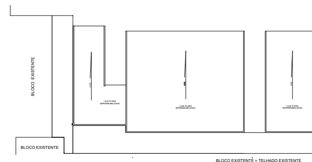
DIAGRAMA DE COBERTURA A CONSTRUIR ESCALA:.....1 / 125