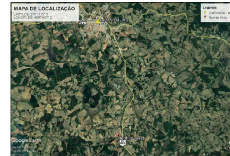
LOCALIZAÇÃO DA E. M. PREF. ABEILARD RODRIGUES PEREIRA SITUADA NO DISTRITO DE HERMILO ALVES - CARANDÁ - MG.